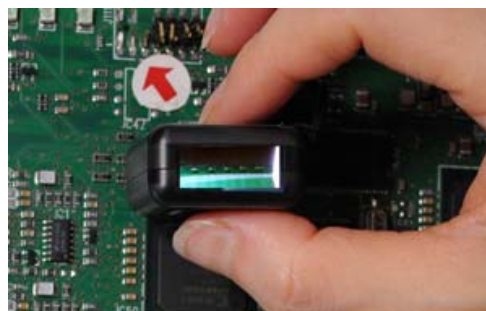
BGAチェックイメージ