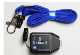
PR-1 本体とストラップ