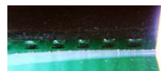
ソルダーボールチェック